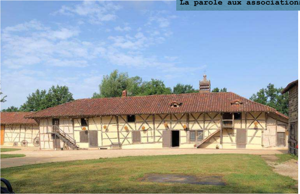
La Ferme du Sougey dans l'Ain