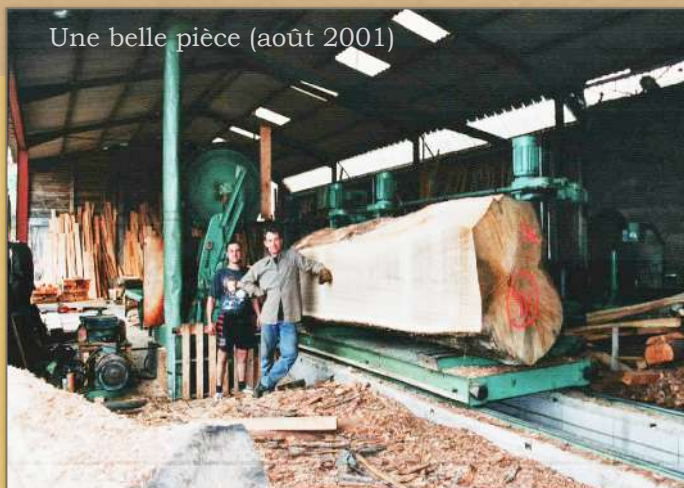
Une belle pièce (août 2001)